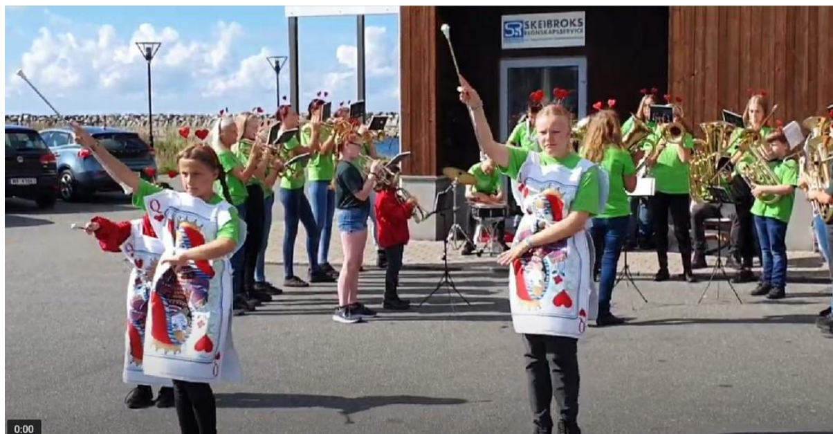
Båro BK hadde egne kostymer og arrangerte sammen med korpset

Vi arrangerte i samarbeid med frivillighetens år bridgens dag i 2022. Det var en stor landsdekkende suksess som vi allerede mener å se resultater av. Vi skal arrangere bridgens dag 16. september i 2023 også! Vi ønsker å spre det glade budskap over det ganske land og håper på stor deltakelse og entusiasme i organisasjonen. NBF stiller i år som i 2022 med arrangementsstøtte og nødvendig materiell.