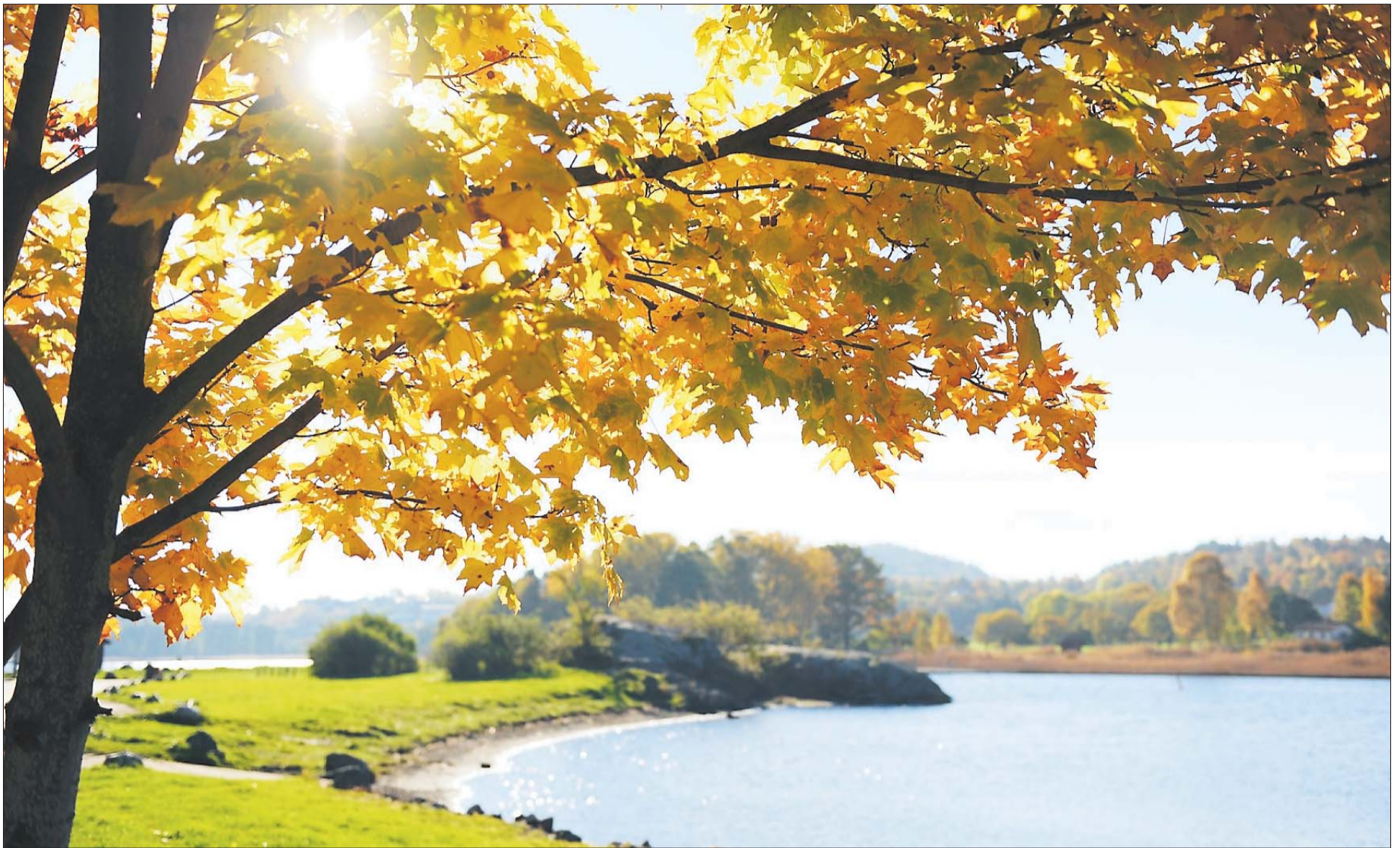
MYE LØV: Løvøya Camping og Båthavn har avsluttet for sesongen. Solen er fortsatt tilstede, men nå gjennom høstgule blader.