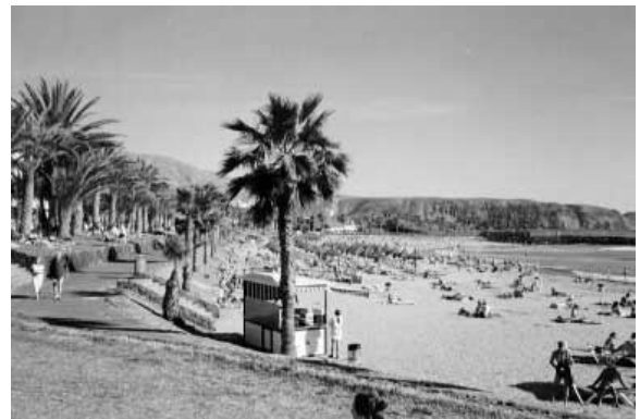
Playa de la Vistas er den største av de tre strendene i Los Cristianos.

Nede ved havnen har Fred Olsen ekspressbåter med daglige avganger til La Gomera og El Hierro. Til La Gomera tar det en knapp time, til El Hierro noe lenger.