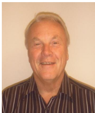
Instruktør Nick BBO: bryde1