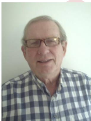
Instruktør Nick BBO: knutk