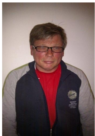
Instruktør Nick BBO:

I mine yrkesår jobbet jeg som sekretær i bank og forsikring. Jeg har noe erfaring fra arrangement av bridgeturneringer, bl.a. bedriftsmesterskapet, lokale turneringer og festivalen.