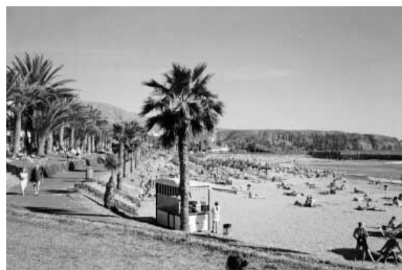
Playa de la Vistas er den største av de tre strendene i Los Cristianos.

Nede ved havnen har Fred Olsen ekspressbåter med daglige avganger til La Gomera og El Hierro. Til La Gomera tar det en knapp time, til El Hierro noe lenger.