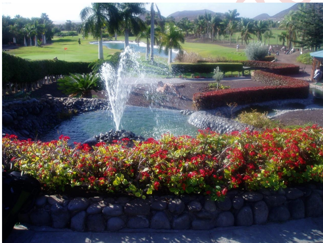
Her er et bilde fra flotte Los Palos golf på Tenerife.