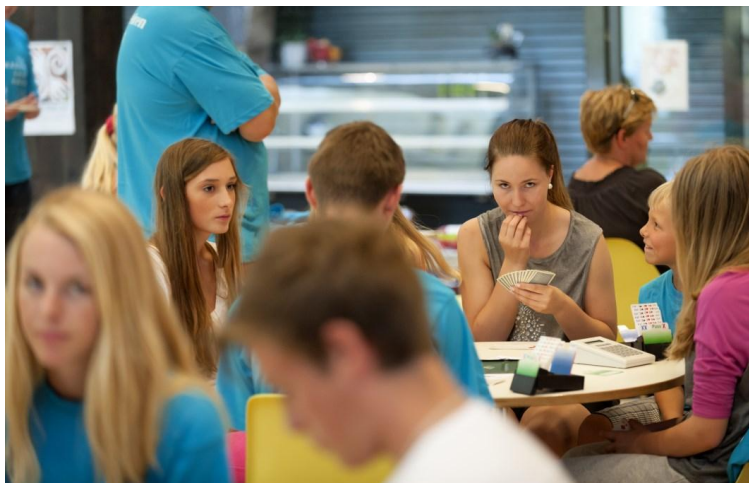
Juniorleiren i Fredrikstad 2013.

Hvis du er nysgjerrig og lurer på om dette kan være noe for deg, meld deg på til første samling torsdag 10. april kl 18.00. Send i så fall en e-post til oystein.hanevik@hlfbrikskeby.no , eller ring eller send en sms til Øystein på 91 91 54 10 .